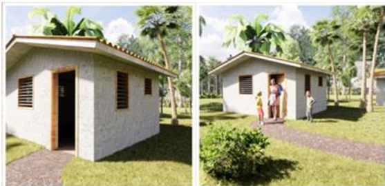
3D impressie van het standaard Filipijnse huis

In 2023 hebben wij 2 huizen kunnen bouwen. Huizen waarin Filipijnse families menswaardig kunnen wonen. De woningen hebben allemaal een keuken en een apart toilet die aangesloten is op een eigen beerput.