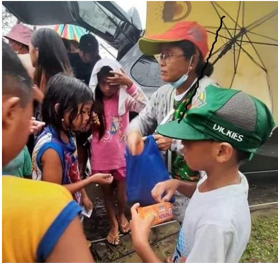
Bij het uitdelen heeft Eday altijd iets extra's voor de kinderen