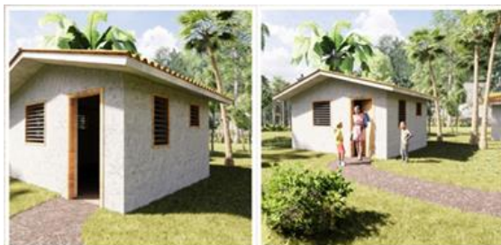
3D impressie van het standaard Filipijnse huis

Iedere keer als er weer voldoende middelen zijn wordt de lokale timmerman met zijn helpers ingeschakeld. Drie week later trekt een dolgelukkige familie in het huis.